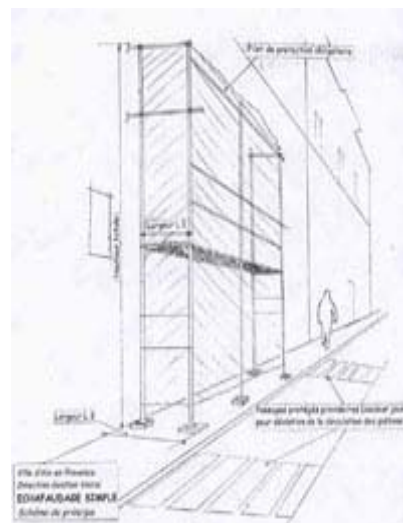
Echafaudage simple (Schéma de principe)

L'occupation du Domaine Public est soumise au règlement de droit de voirie.